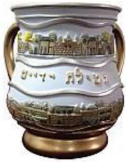
[ "יודאיקה" ]

יֵאֵיךְ נוֹטְלִים יָדַיִם? מִמְּלָאִים כְּלִי וְנוֹטְלִים מִמֶּנּוּ, פֶּעַם עַל יַד יְמִין וּפֶעַם עַל יַד שְׂמָאל וְעוֹד פֶּעַם.. כֹּה - שְׁלֹשׁ פְּעָמִים (יש שְׁנוֹטְלִים אַרְבַּע פְּעָמִים). וּמְבָרְכִים: "בְּרוּךְ אַתָּה ה' אֱלֹהֵינוּ מֶלֶךְ הָעוֹלָם אֲשֶׁר קִדְּשָׁנוּ